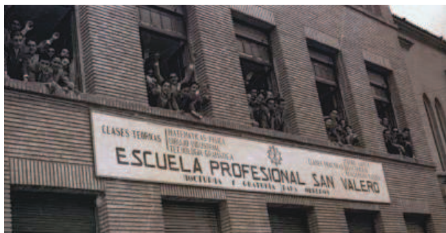
⌚ Sobre estas líneas, clase de electrónica en el Centro San Valero de finales de la década de los setenta. ⌚ A la izquierda, fachada de la originaria Escuela Profesional San Valero. ⌚ A la derecha, imagen de San Valero en la entrada del actual Centro San Valero, donde se imparte la etapa de secundaria y formación profesional.