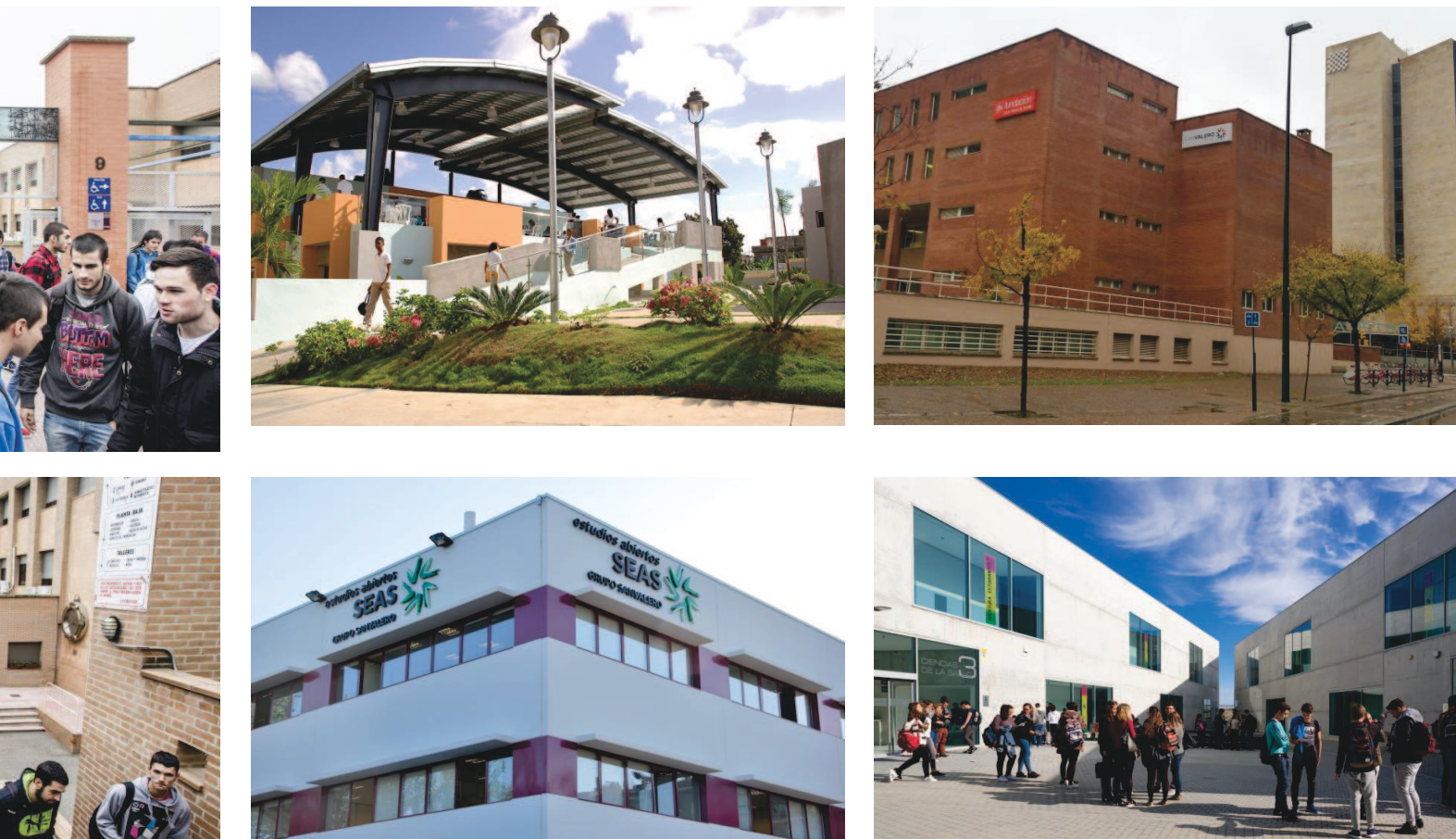
⦿ A la izquierda, imágenes de los cinco centros que integran el Grupo San Valero. De izquierda a derecha y de arriba a abajo: entrada del Centro San Valero, Fundación Dominicana San Valero, fachada del CPA Salduie, edificio que alberga las oficinas centrales del grupo; alumnos de secundaria en el centro, sede de SEAS, Estudios Abiertos; e instalaciones de Universidad San Jorge.

En el ámbito de la cooperación al desarrollo, y como uno de los proyectos más importantes impulsados desde Aragón, se crea la Fundación Dominicana San Valero. Este centro, ubicado en el barrio de los Guaricanos de Santo Domingo (República Dominicana), se creó en 1995 para ayudar, mediante la formación, a la población con menos posibilidades y recursos.